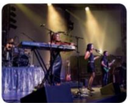
The Corrs (Irlanda)