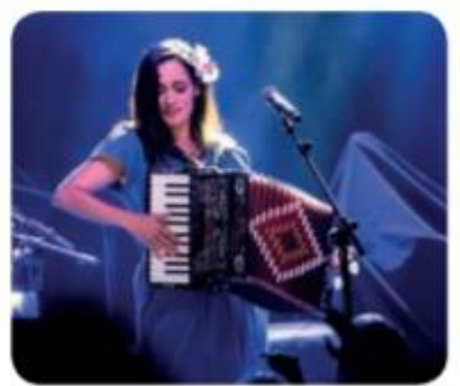
Julieta Venegas (México/EE.UU.)