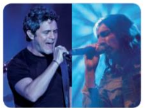
Alejandro Sanz y Antonio Carmona (España)