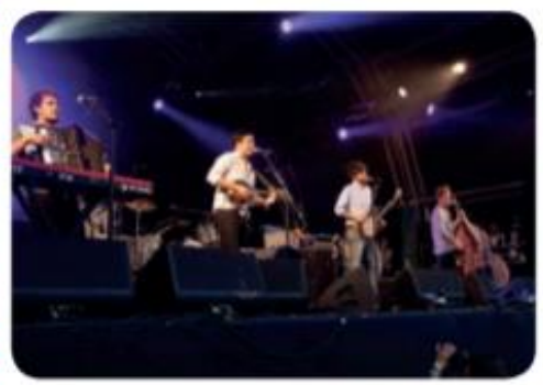
Mumford and Sons (Inglaterra)