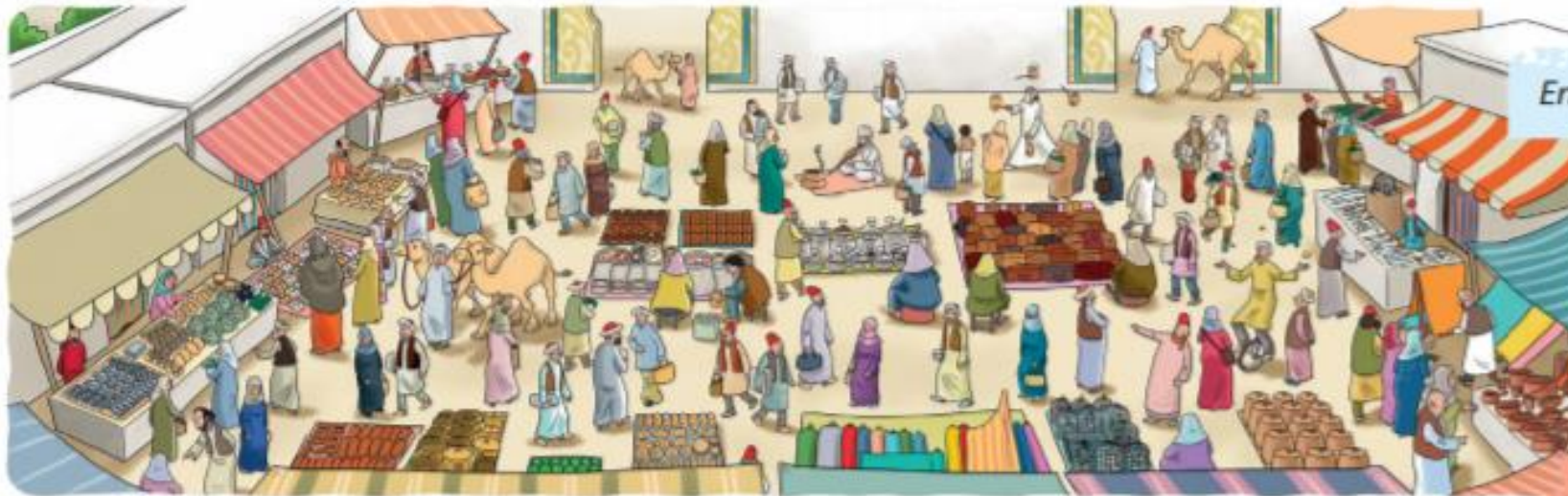
En un mercado persa.