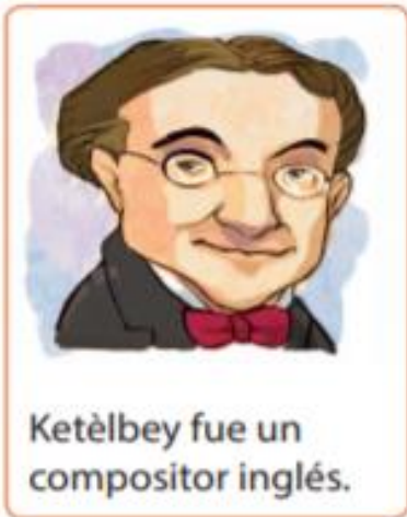
Ketèlbey fue un compositor inglés.