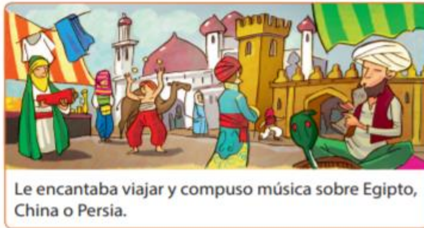
Le encantaba viajar y compuso música sobre Egipto, China o Persia.