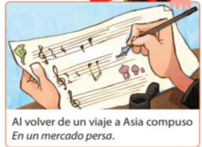
Al volver de un viaje a Asia compuso En un mercado persa .